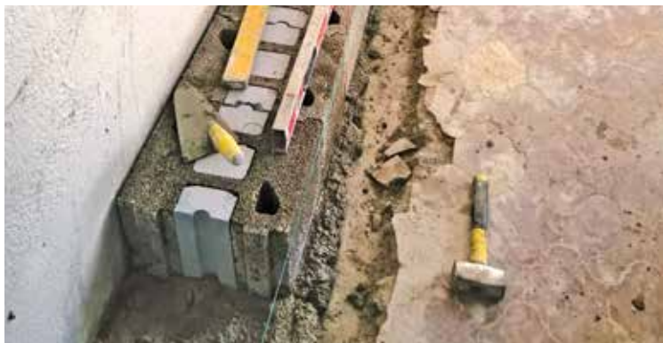
Parete in Lecablocco Bioclima Zero29T per la riqualificazione energetica dell'involucro esterno.

Per la messa in sicurezza del tamponamento interno si è provveduto ad intervenire, sempre dall'esterno delle unità abitative, applicando un presidio di antiribaltamento in FRCM a piena superficie opportunamente collegato al telaio in c.a. con specifici connettori oltre che con un profilo continuo in acciaio.