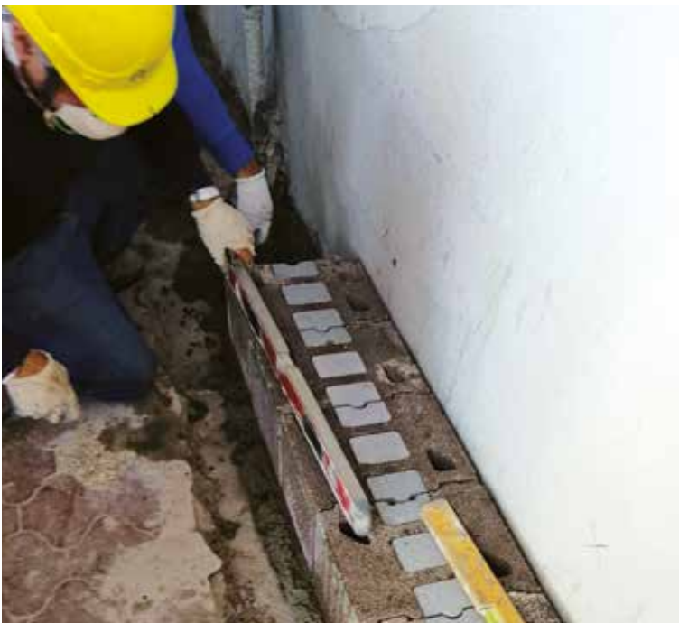
Parete in Lecablock Bioclima Zero29T per la riqualificazione energetica dell'involucro esterno.

L'edificio è uno dei primi cantieri in Italia che ha usufruito del cosiddetto Superbonus 110% sia per la categoria trainante del risparmio energetico (EcoBonus) sia per interventi antisismici (SismaBonus).