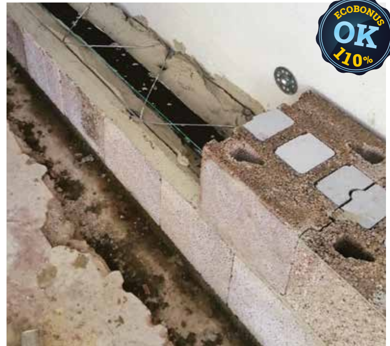
La parete in Lecablock Bioclima Zero29T è stata posata con Malta Leca M5 Supertermica per ottimizzare il comportamento della parete, con striscia isolante e traliccio metallico.